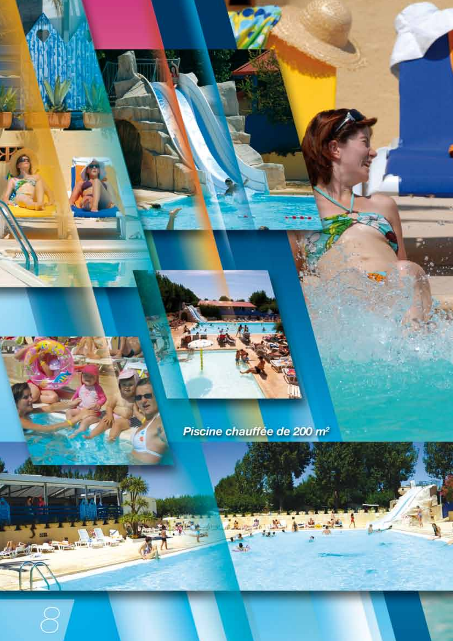
Piscine chauffée de 200 m 2